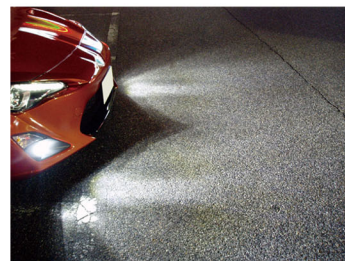
White 6000k 路面照射