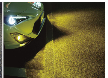
Yellow 2400k 路面照射